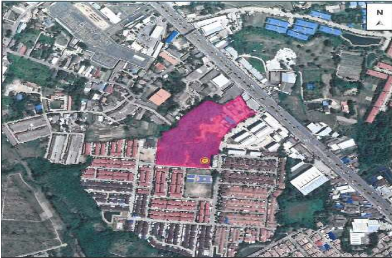
รูปที่ 1.2-1 ตำแหน่งที่ตั้งโครงการ